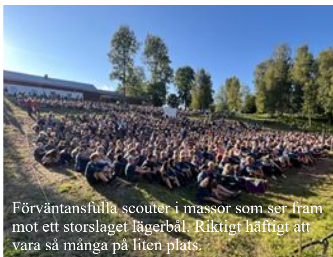
Förväntansfulla scouter i massor som ser fram mot ett storslaget lägerbål. Riktigt häftigt att vara så många på liten plats.

En dag var vi på dagsparning på ungefär 4 km där det fanns lite klurigheter att lösa på kontrollerna. Lite synd att det blev så lång väntan på vissa kontroller men det var fin natur att gå genom. En kväll var några av oss på nattspårning som var väldigt spännande med farliga "fifuner" som letade efter oss i skogen samtidigt som vi sökte ledtrådar till att hjälpa en expedition som hade gått fel. På spontanaktiviteterna fanns det mycket att göra, vi var i biblioteket, på café, passade på att göra oss fräscha genom bad i sjön, vi besökte också ett gamingtält där vi spelade dataspel, jag hängde inte riktigt med i svängarna där. Som ni förstår så var lägret på ett stort område, bara att gå och hämta mat och tillbaka var ungefär 2 000 steg, snittet per dag låg på 15 000 steg, så det är inte undra på att vi sov gott i tältet vissa hårdare än andra och det hördes på dess snarkningar.