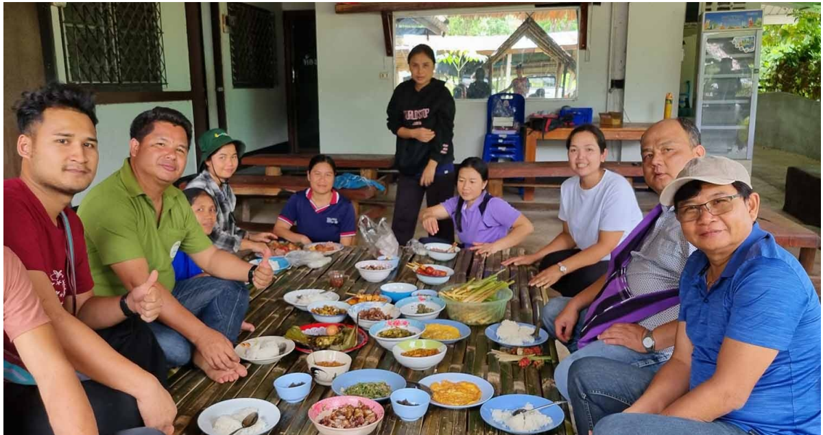
Måltid tillsammans med de andra ledarna för skolan.