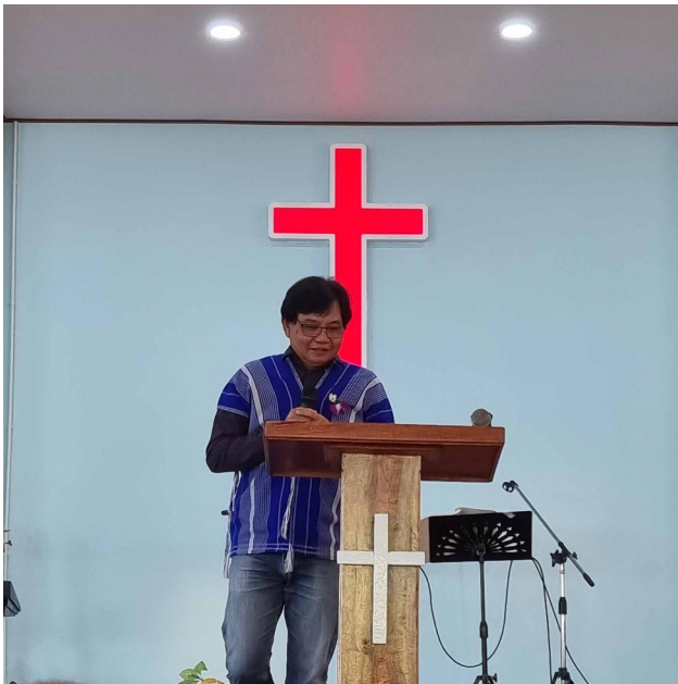
Invigning - Veasna ber för den nya kyrkan.